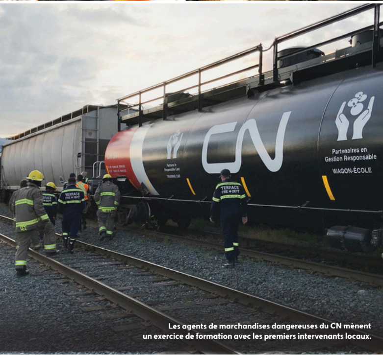
Les agents de marchandises dangereuses du CN mènent un exercice de formation avec les premiers intervenants locaux.